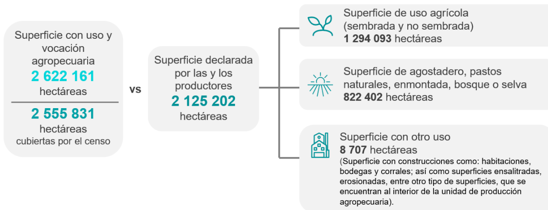
Gráfica 1 SUPERFICIE CON USO Y VOCACIÓN AGROPECUARIA

El Censo Agropecuario revela que, en 2022, en Guerrero había 319 915 unidades de producción agropecuaria y 1 294 093 hectáreas de superficie agrícola. Las unidades de producción se distribuyeron de la siguiente manera: 289 205 fueron unidades de producción activas 4 , con 1 149 425 hectáreas de superficie agrícola y 30 710 fueron unidades de producción agropecuaria sin actividad, 5 con 144 668 hectáreas de superficie agrícola.